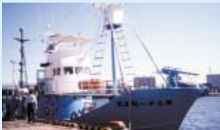
小型捕鯨船 第31純友丸

IWCの科学委員会は、既に改訂管理方式(RMP)と言われる安全のうえにも安全をみた捕獲枠の計算方法を完成させています。これに基づいて計算した結果から150頭という数字は導き出されました。従って、毎年150頭のミンク鯨を小型捕鯨の漁師さん達が捕獲し続けても、資源には何の影響もありません。